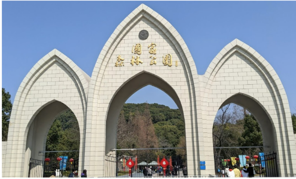
East Sheshan Mountain (above)←